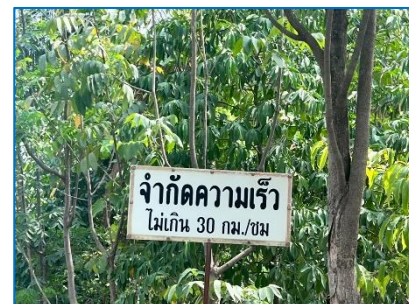
ป้ายจำกัดความเร็ว