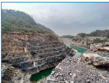
หน้าเหมืองปัจจุบัน