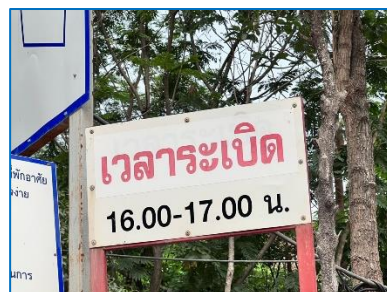
ป้ายเวลาการระเบิด