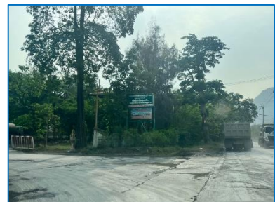
ป้ายสำนักงานโครงการ