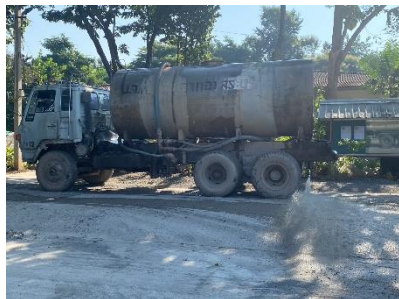
รถฉีดพรมน้ำ