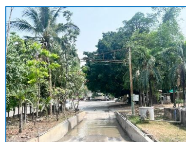
บ่อล้างล้อ