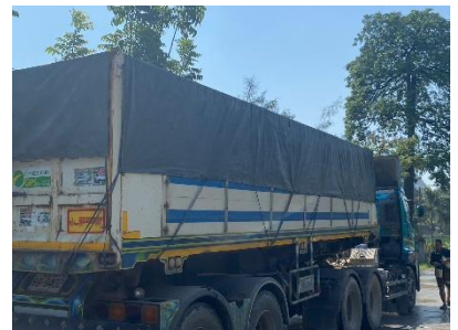
การปิดคลุมผ้าใบรถบรรทุก