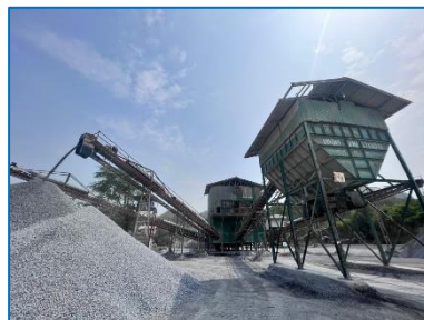
โรงโม่หินของโครงการ