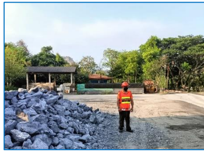
พนักงานสวมใส่อุปกรณ์ป้องกันอันตราย