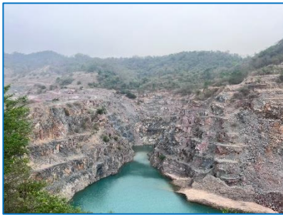
หน้าเหมืองลักษณะชันบันได